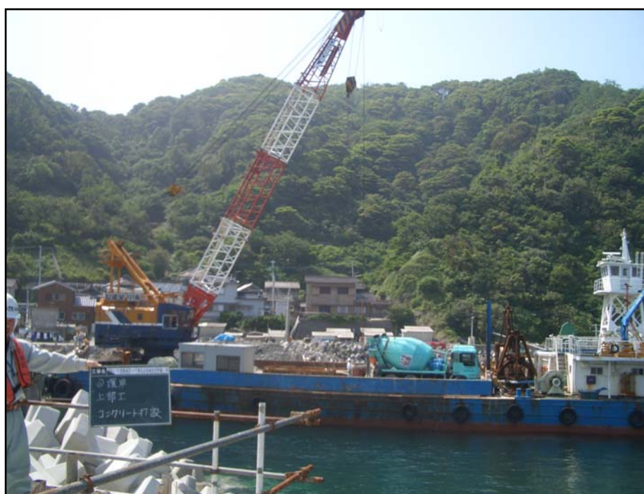
【無垢島(津久見市)でのコンクリート打設状況】